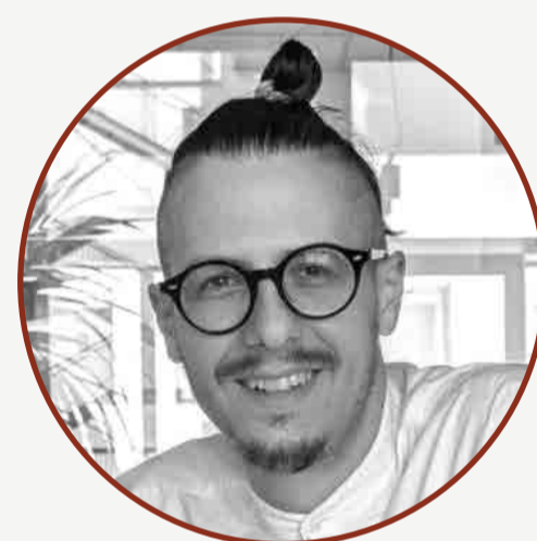
LORENZO ALBAI STUDIO SETTANTA7